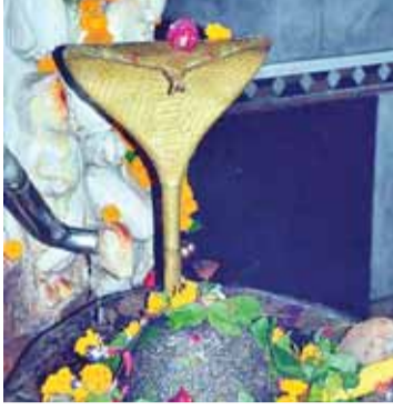
के साथ शिवालयों में ॐ नमः शिवाय, हर-हर महादेव का जप करते रहे, वहीं मदन महल की पहाड़ी में मां के जयकारों की गूंज सुनाई देती